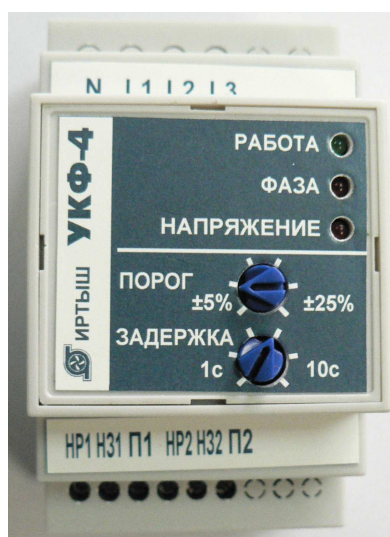
Рисунок 1а. Внешний вид изделия

На верхней плоскости крышки располагаются три индикатора. Индикатор РАБОТА сигнализирует о подаче на изделие кондиционного напряжения питания. Индикатор ФАЗА сигнализирует о неправильном порядке чередования фаз, отсутствии одной из фаз или слипании фаз. Индикатор НАПРЯЖЕНИЕ сигнализирует о повышенном или пониженном напряжении на одной или нескольких фазах. Регулятор ПОРОГ устанавливает возможные допустимые отклонения сетевого напряжения в пределах \pm 5\% \dots \pm 25\% . Регулятор ЗАДЕРЖКА устанавливает время срабатывания/восстановления при возникновении аварийных режимов в сети питания.